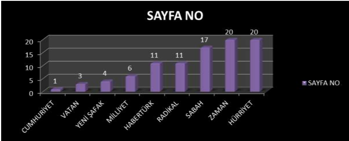
Grafik 2: Ulusal günlük gazetelerin köşe yazılarının sayfa numarası dağılımı

Grafik:2 Spor içerikli Köşe yazıları; Cumhuriyet 1.sayfa, Vatan 3 sayfa, Yeni Şafak 4, Milliyet 6, Haber Türk 11, Radikal 11, Sabah 17, Zaman 20, Hürriyet gazetesinde ise 20. sayfa da yer verdikleri tespit edilmiştir.